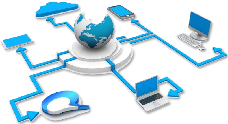
Gambar 4.1 Platform, Infrastruktur Perusahaan, dan Tata Kelola

Pada bab ini yang akan membahas topik yang sangat penting dalam konteks E-Commerce dan e-bisnis, yaitu platform, infrastruktur perusahaan, dan tata kelola. Platform dalam e-bisnis merujuk pada lingkungan teknologi yang digunakan untuk menjalankan operasi bisnis secara elektronik. Lingkungan e-bisnis dapat muncul di berbagai keadaan bagi perusahaan untuk mengkonfigurasi ulang proses bisnis mereka sebagai contoh di bidang pemasaran, dan layanan pelanggan perusahaan untuk beradaptasi dengan operasional pasar melalui saluran ritel digital sebagai bagian dari omnichannel , pemasaran media sosial, dan platform ekosistem sehingga dengan adopsi e-bisnis yang diimplementasikan melalui penggunaan mobile commerce dan