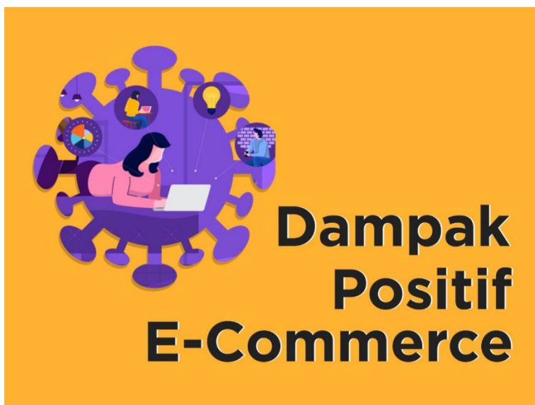
Gambar 7.1 Dampak Positif dan Negatif Pemasaran Media Online