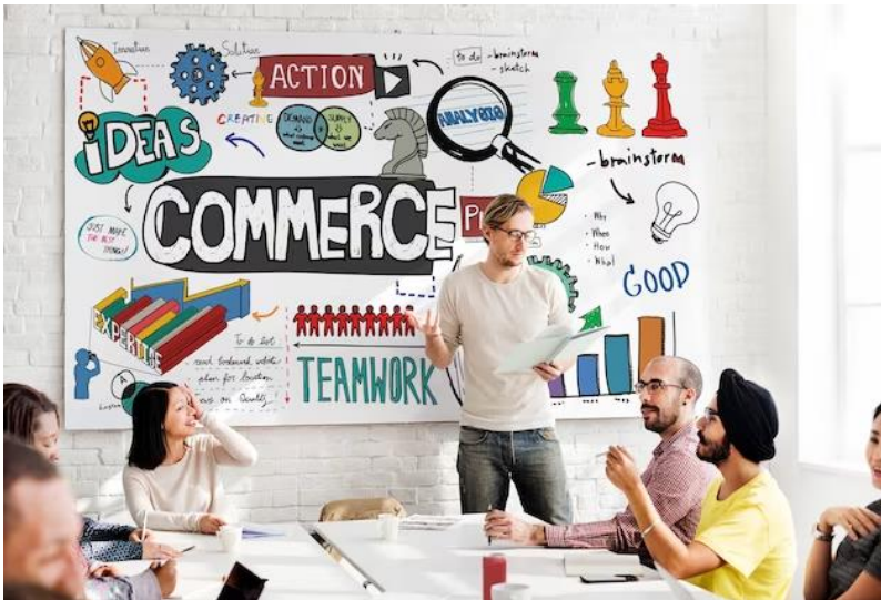
Gambar 11.1 Pemasaran Online dan Digital