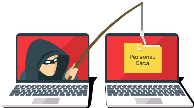
Gambar 12.1 Keamanan dan Privasi dalam E-Commerce

E-Commerce adalah aktivitas komersial melalui alat elektronik. Ini didasarkan pada pemrosesan elektronik dan transmisi informasi (teks, video, audio). E-Commerce melibatkan banyak aktivitas barang dan jasa, pengiriman informasi digital secara elektronik, lelang elektronik, pemasaran langsung ke konsumen.