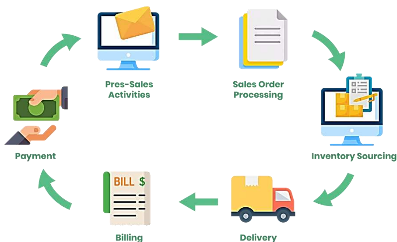
Gambar 9.1 Dasar-Dasar E-Commerce

E-Commerce merupakan istilah yang merujuk pada kegiatan jual beli barang atau jasa yang dilakukan secara elektronik melalui internet. Dasar-dasar E-Commerce meliputi beberapa konsep dan elemen penting yang menjadi pondasi bagi bisnis online. Pemahaman yang mendalam terhadap dasar-dasar tersebut akan membantu dalam merancang, mengelola, dan mengembangkan bisnis E-Commerce secara efektif di pasar digital yang terus berkembang.